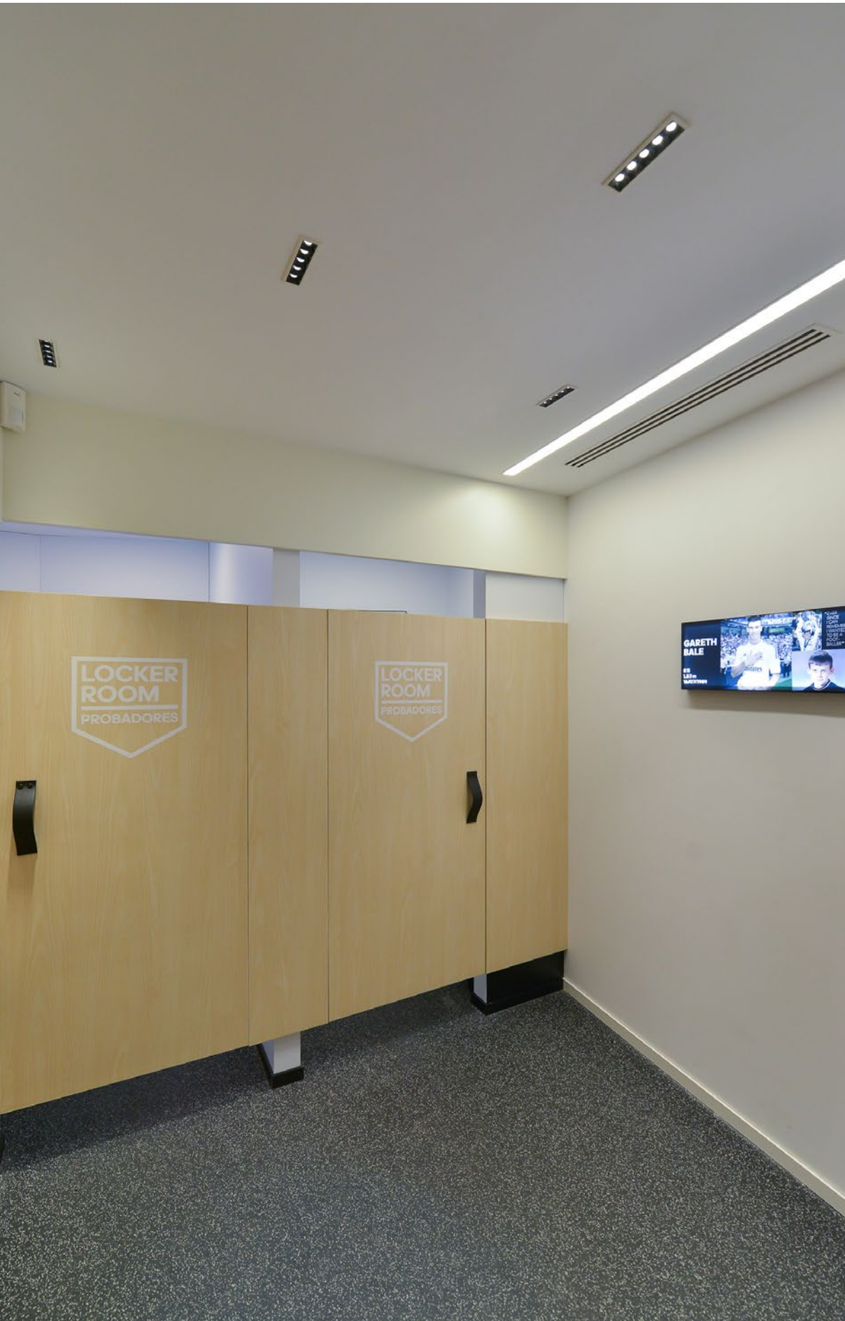
en la imagen_in the picture