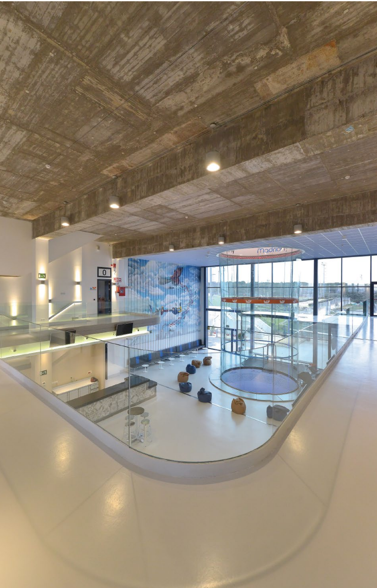
en la imagen_in the picture