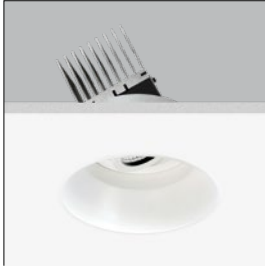
CEILING CUT Ø170